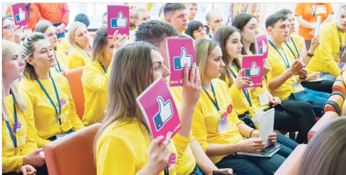
Участниками слёта стали 100 молодых железнодорожников и студентов профильных учебных заведений