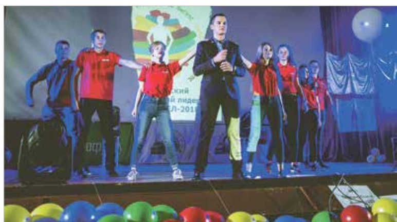
Команды активно поддерживали своих лидеров

Представители профсоюзного студенческого актива не остались в стороне от обсуждений и выступили с докладами и предложениями.