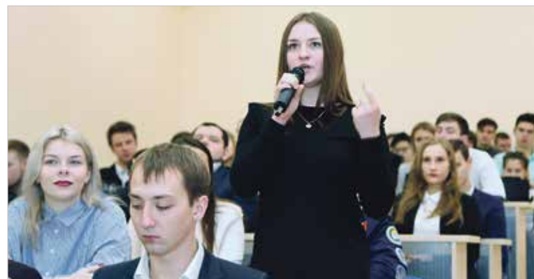
В процессе дискуссии можно не только задать вопрос, но и поспорить

Целый ряд мероприятий студенческого профкома превратился в добрую традицию. Статус ежегодных проектов, объединяющих сотни участников, получили кубок по мини-футболу, турнир по боулингу, игра для первокурсников на командообразование «Первый рейс», а в прошлом году дебютировал конкурс «Интеллект-Баттл» — азартное состязание за звание