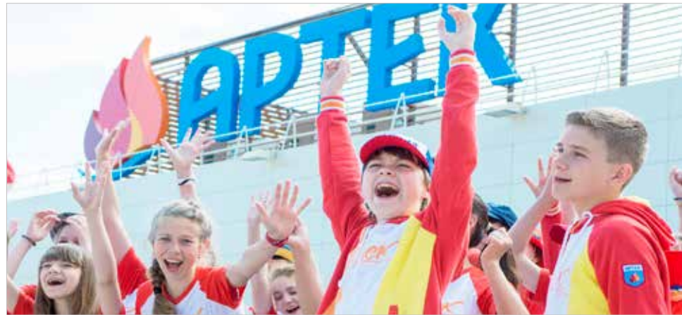
Детский центр «Артек» — мечта каждого ребенка

Нет? Значит будет! И сегодня уже не только заключено партнёрское соглашение между ОАО «РЖД» и МДЦ