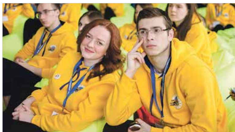
На тренингах и мастер-классах ребята узнали много полезной информации о работе профсоюза

эффективной работы студенческих СМИ, обменялись опытом. 90 студентов и 9 их руководителей соревновались за звание лучшего студенческого профсоюзного лидера в общекомандных и индивидуальных