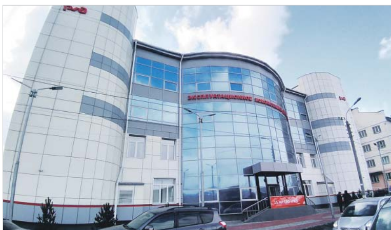
В новом здании депо Чита работать комфортно

«Любям приятно, что о них позаботились, — говорит