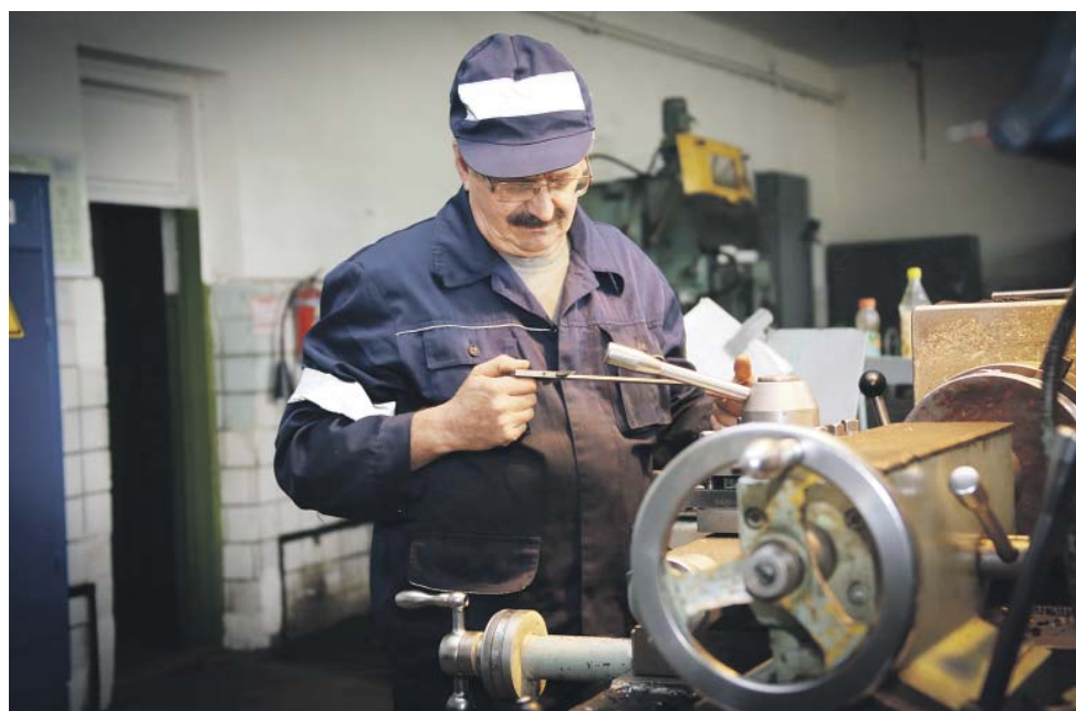
На каждую операцию отводится определённое количество времени