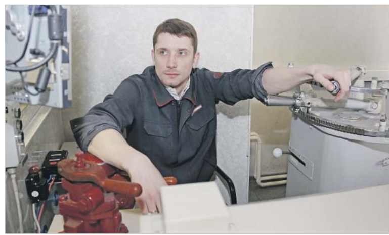
На тренажёре локомотивщики отрабатывают, как правильно вести себя в нестандартной ситуации

Из молодого человека, пришедшего на предприятие после колледжа, машиниста только предстоит сделать — воспитать у него интерес к работе, бережное отношение к железнодорожным традициям, нетерпимость к нарушениям. Это — часть производственного процесса, залог безопасности движения. Ведь все правила и инструкции, по которым мы работаем, созданы на основании обобщённого опыта многих поколений железнодорожников. Но, к сожалению, ребята не всегда об этом задумываются и зачастую относятся к работе лишь как к средству заработка, без «лишних» эмоций, порой не осознают значимость профессионального совершенствования. Им кажется, что при необходимо-