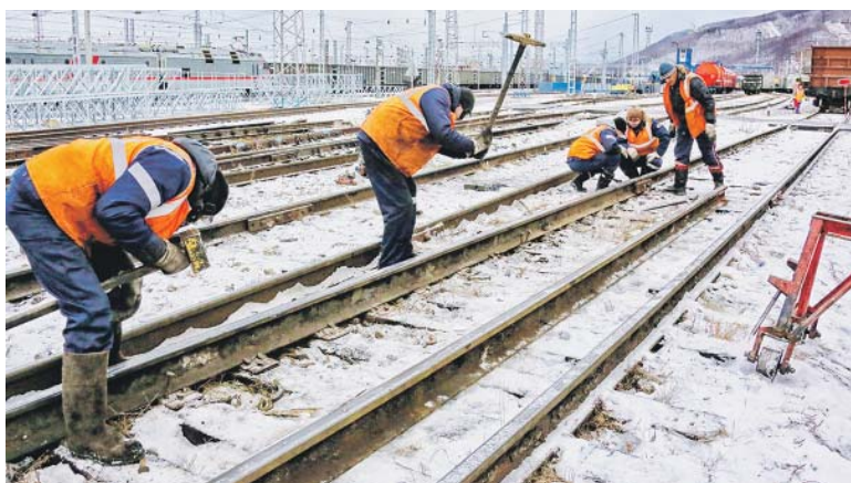
Работа путейцев во время «окна» требует особой сосредоточенности и слаженности