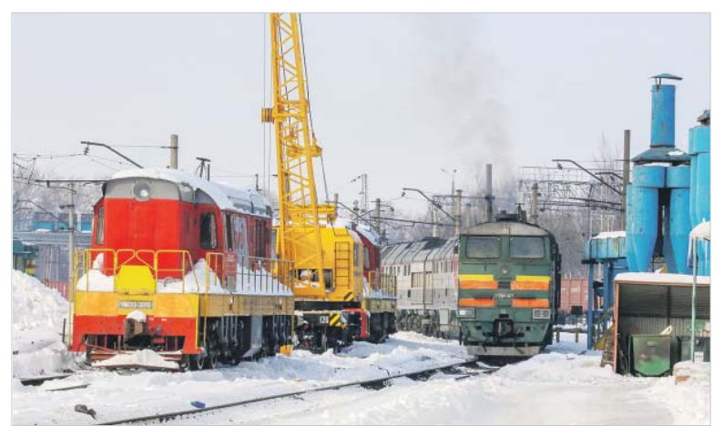
Территория локомотивного депо Ярославль-Главный