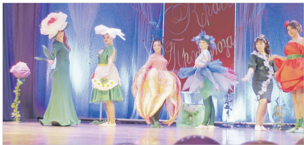
Один из самых увлекательных конкурсов «Цветочная фантазия»

Группы поддержки поднимали баннеры, транспаранты, выкрикивали слова поддержки. Девушки — а только они знают, каких трудов им это стоило, — держались великолепно. И можно представить, как сложно было членам жюри выбрать среди них наиболее достойную. Но судьи справились, и места распределились следующим образом: