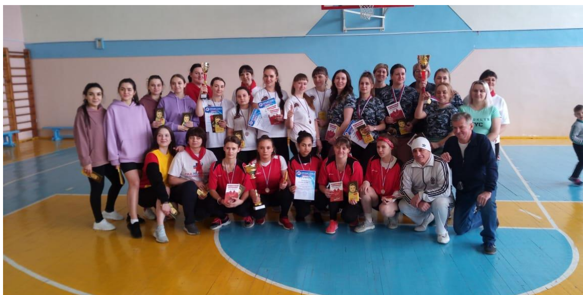
На фото: участники женской спартакиады

6 марта – прошло спортивное мероприятие узла Нижнеудинск, среди работников железнодорожных предприятий, в санатории – профилактории «Истоки», посвящённое Международному женскому Дню.