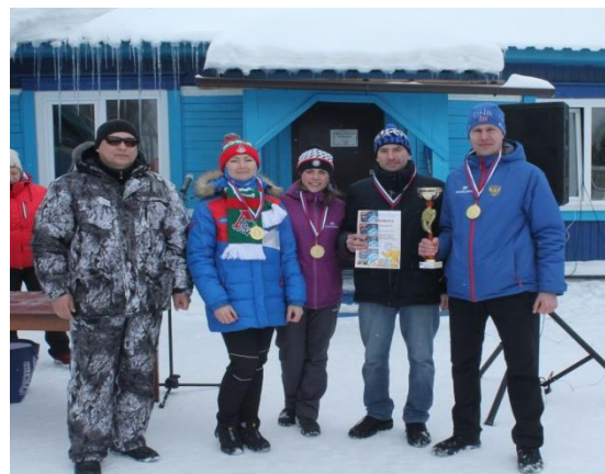
На фото: команда Тайшетского региона занявшая