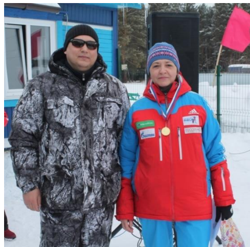
На фото: участницы лыжных соревнований

Борьба за лидерство на всех дистанциях была напряженной и упорной. Эмоции, спортивный азарт и желание победить переполняли всех спортсменов. Самыми быстрыми оказалась сборная команда Тайшетского региона, вторыми были работники эксплуатационного локомотивного депо Тайшет и бронзу забрали