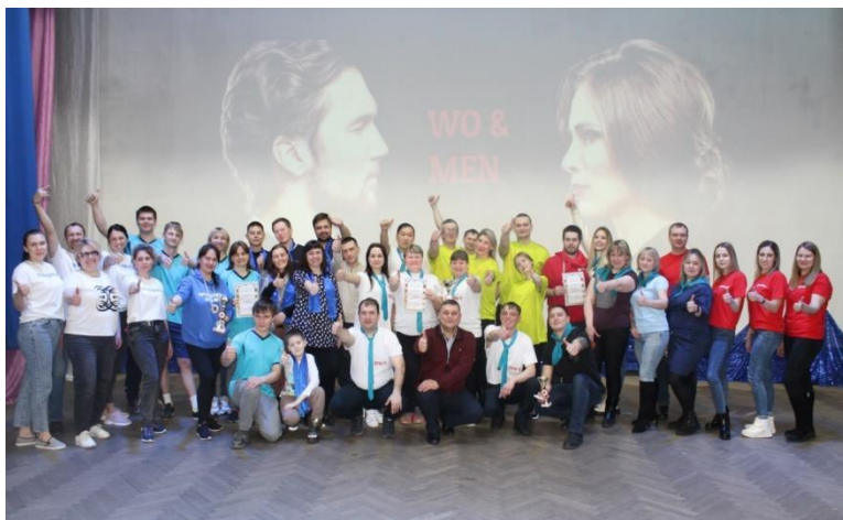
Участники игры КВЕСТ