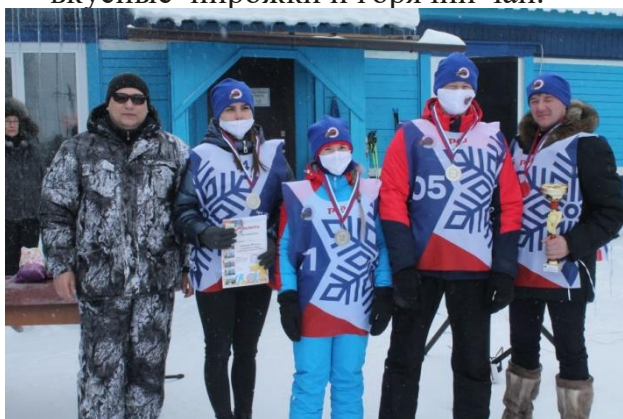
На фото: команда ТЧЭ-1 1 место в Лыжной эстафете занявшая 2 место в Лыжной эстафете

педагоги школы – интернат № 24. Для участников и гостей были организованы вкусные пирожки и горячий чай.