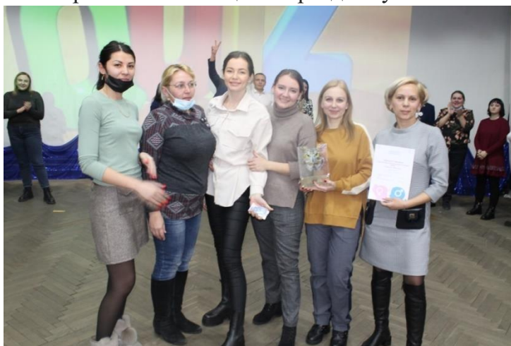
На фото: победители первой интеллектуальной игры КВИЗ работники НГЧ-1

Новый сезон, полюбившийся железнодорожникам, интеллектуальной игры КВИЗ открылся в БЦК и ДКЖ. Первая Игра была посвящена празднику - Международному женскому Дню.