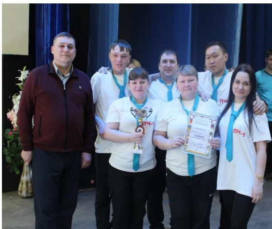
На фото: команда ПЧ-1 занявшая I место в игре КВЕСТ