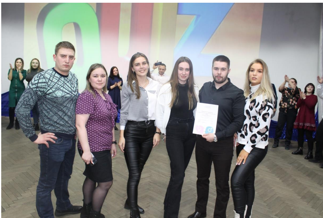
На фото: команда ТЧЭ-1 «Впереди Сапсана»

6 марта – прошло спортивное мероприятие узла Нижнеудинск, среди работников железнодорожных предприятий, в санатории – профилактории «Истоки», посвящённое Международному женскому Дню.