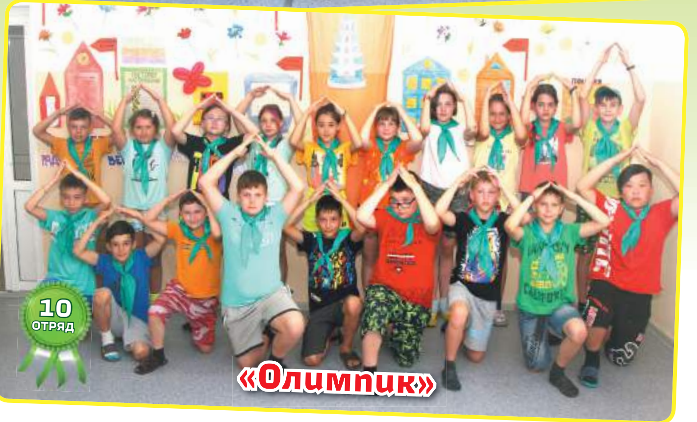
«Дети радужного века»